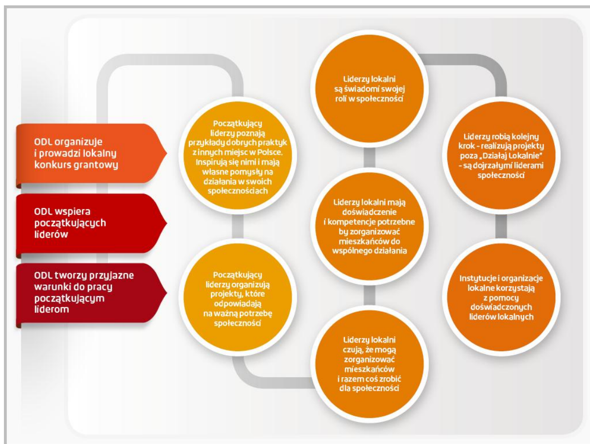
Ścieżka rozwoju animatorów lokalnych do liderów w Programie „Działaj Lokalnie”

Operatorem platformy jest Fundacja Akademia Organizacji Obywatelskich, organizacja dbająca o wysoką jakość zarządzania w trzecim sektorze i podnoszenie kwalifikacji menedżerskich przez kadrę zarządzającą polskimi organizacjami pozarządowymi.