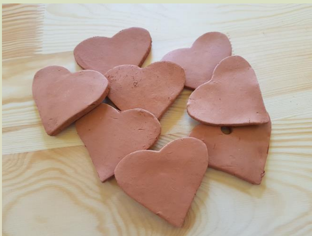
Gotowe, piękne serduszka.