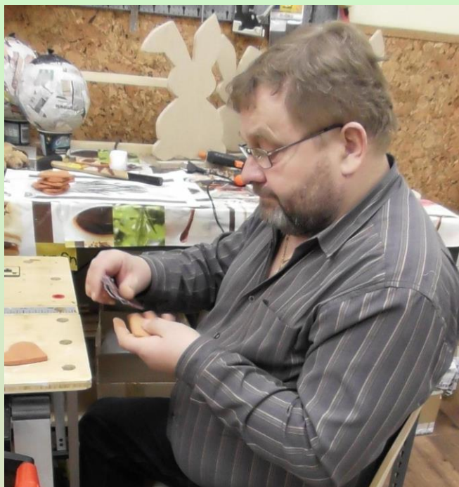
Przygotowywanie do wypalenia.

W pracowni znajduje się również piec ceramiczny. Materiałem używanym przez uczestników jest glina. Podopieczni dopiero zaczynają naukę wytwarzania przedmiotów z tego materiału. Poniżej przedstawiamy to, co udało im się utworzyć na samym początku.