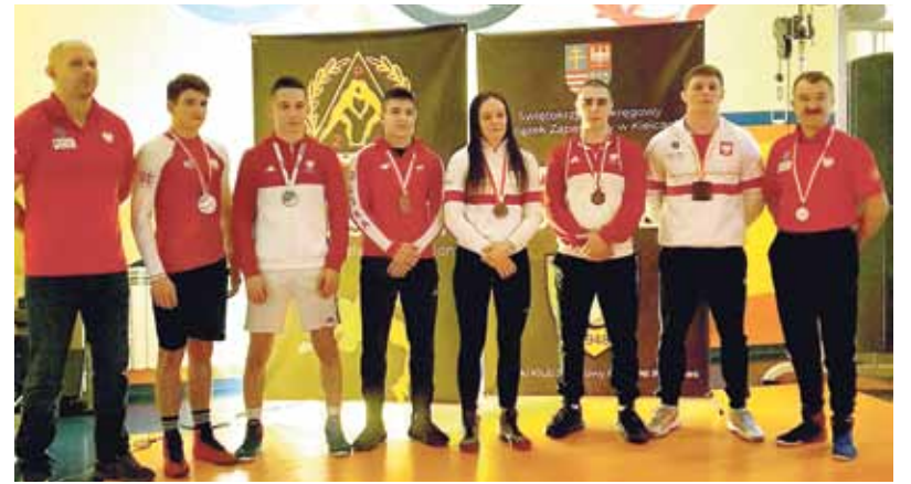
MKS CZARNI POŁANIEC medaliści Mistrzostw Polski 2020 roku.

CZARNI Połaniec uplasował się na historycznym trzecim miejscu (z sumą pkt 131,27). Lepsi od nas okazali się tylko VIVE Kielce (188,48 pkt) i KSZO Ostrowiec Świętokrzyski (270,02 pkt). Na sumę 131,27 pkt zapracowały trzy dyscypliny CZARNYCH. Są to: ŻAPASY – 110,72 pkt (zapasy klasyczne 13,00 pkt, zapasy kobiet 31,72, zapasy wolne 66,00), PIĘKA SIATKOWA – 20