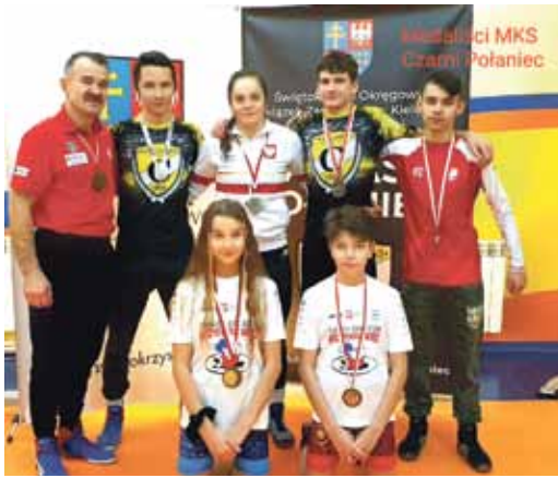
Medaliści MKS CZARNI POŁANIEC.

Świętokrzyska Federacja Sportów w Kielcach opublikowała na podstawie w/w Instytutu Sportu ranking klubów sportowych naszego województwa. W rankingu tym Miejski Klub Sportowy