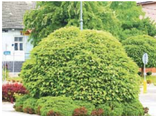
Teren rynku dziś to miejsce, które zachęca do spotkań z przyjaciółmi oraz spacerów i spędzania wolnego czasu całymi rodzinami na świeżym powietrzu.

Całość rynku osłonięta jest z każdej strony piękną roślinnością, która zachwyca od wiosny aż do późnej jesieni. Zieleń charakteryzuje się wysoką atrakcyjnością kolorystyczną i dekoracyjną. Znajduje się tu wiele drzew i krzewów oraz widać dbałość o kompozycje kwiatowe, a w szczególności zachwycają piękne klomby róż. Atrakcyjności dodają usytuowane obiekty małej architektury.