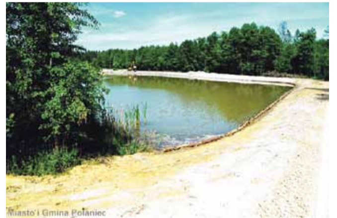
Miasto i Gmina Połaniec

Trwa realizacja zadania polegająca na: „Odmulaniu i czyszczeniu zbiornika wodnego w miejscowości Luszyca”. Jest obecnie na etapie końcowym prac. W ramach przedmiotowego zadania zrealizowano następujący zakres prac: