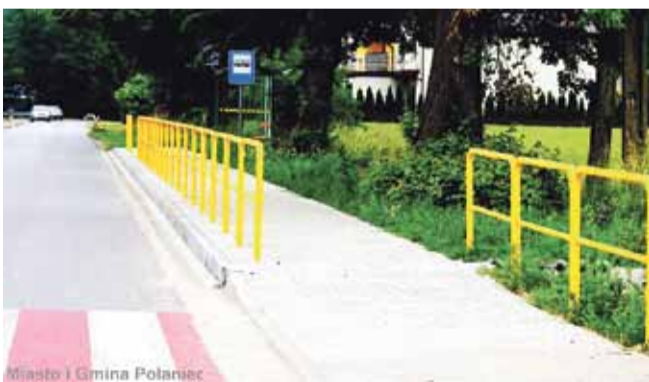
Miasto i Gmina Połaniec