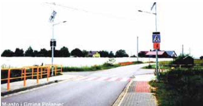
Miasto i Gmina Połaniec

2) „Przebudowa przejścia dla pieszych w ciągu drogi powiatowej nr 0822T Ruszcza - Słupiec w miejscowości Ruszcza” – wartość zadania: 116 308,80 zł