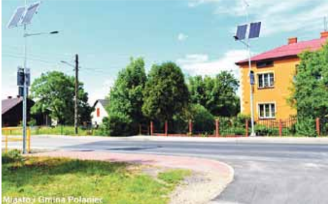
Miasto i Gmina Połaniec

Głównym celem projektu, który udało się osiągnąć to przede wszystkim zwiększenie bezpieczeństwa pieszych poruszających się po drogach naszej gminy. Wykorzystanie nowoczesnych możliwości technologicznych przy tworzeniu przejść dla pieszych znacznie poprawia ich widoczność, co owocuje wzrostem świadomości w zakresie bezpiecznego przejścia.