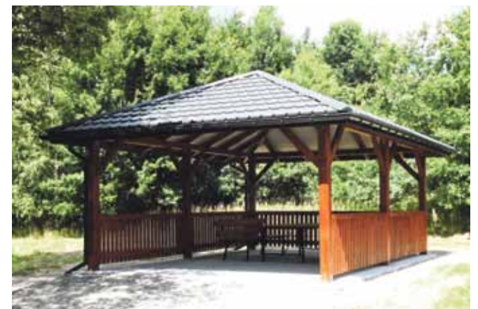
BRZOZOWA – 39 433,60 zł brutto

Budowa obiektów dobiegła właśnie końca, a 15 lipca odbył się odbiór zadania. Z powstałych obiektów korzystać będą mogli wszyscy zainteresowani (dzieci, młodzież, dorośli oraz turyści) bezpłatnie, każdego dnia tygodnia i przez cały rok z uwagi na fakt zadania obiektu. Altany posiadają podłogę z kostki betonowej, konstrukcję dachową czterospadową (wieżba drewniana) - pokrytą blachodachówką. Dodatkowym wyposażeniem jest drewniany stół i dwie ławki. Wszystkie altany powstały w ramach środków z funduszu sołeckiego.