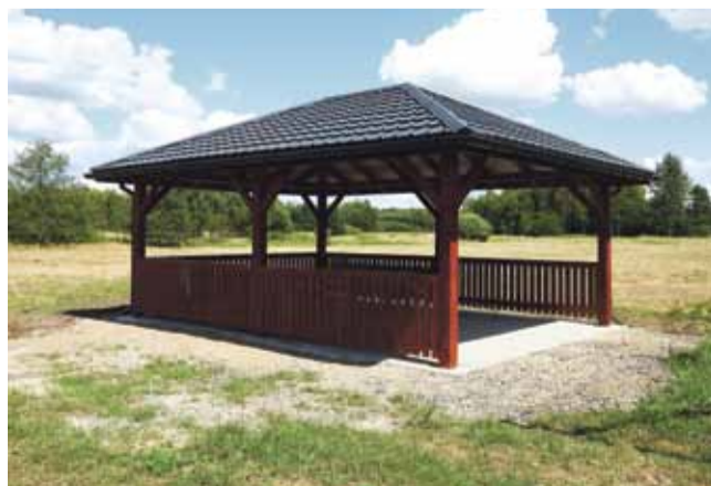
KAMIENIEC – 39 433,60 zł brutto