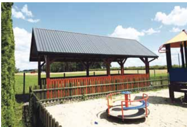
RUSZCZA KĘPA – 36 861,14 zł brutto

KWOTY REALIZACJI ZADAŃ I EFEKTY PRAC PRZEDSTAWIAJĄ SIĘ NASTĘPUJĄCO: