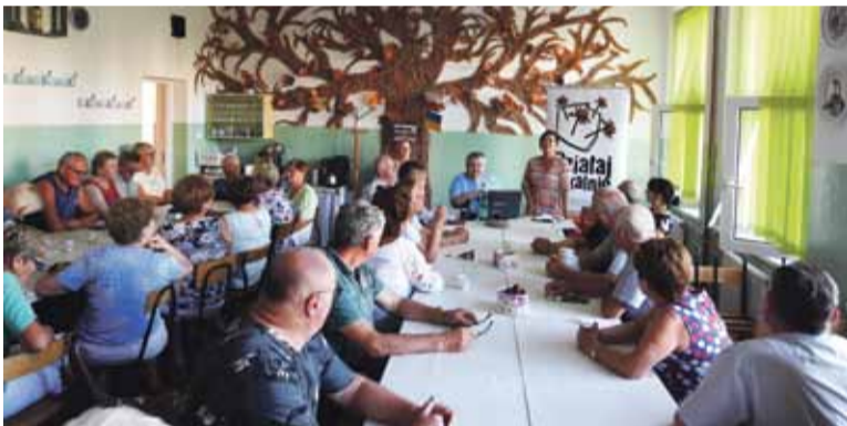
Seniorzy aktywnie uczestniczący w warsztatach psychologicznych