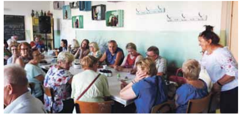
Miejsce warsztatów z psychologiem: siedziba Klubu „Megawat”

Tematyka bardzo ciekawych zajęć dotyczyła pozytywnego myślenia. Mogłoby się wydawać, że nie ma nic bardziej prostszego niż myślenie pozytywne. W końcu wystarczy po prostu myśleć