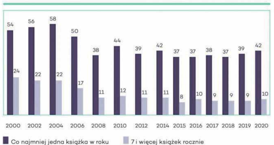
WYKRES 1. Czytanie książek w latach 2000–2020 (dane w procentach)