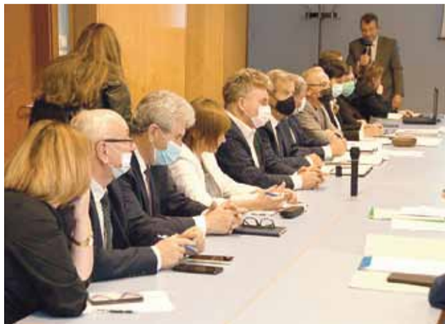
Zdjęcie przedstawia posiedzenie sztabu zarządzania kryzysowego z związku z ASF.

W dniu 21 października pod przewodnictwem Wojewody Świętokrzyskiego odbyło doraźne posiedzenie Wojewódzkiego Zespołu